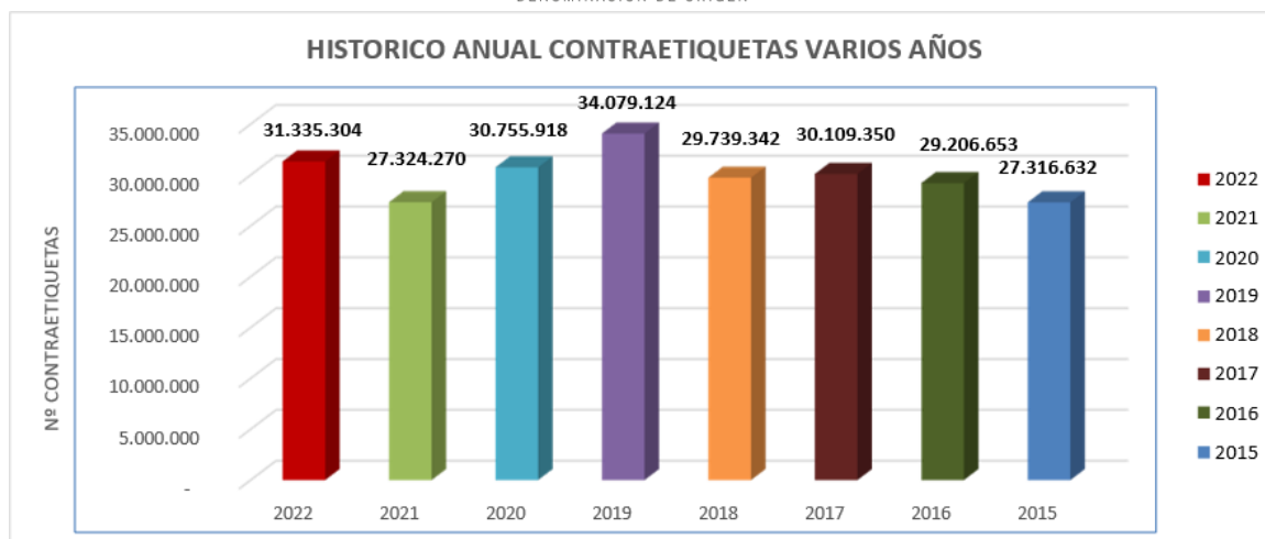
Histórico de contraetiquetas expedidas de la DO Utiel-Requena.