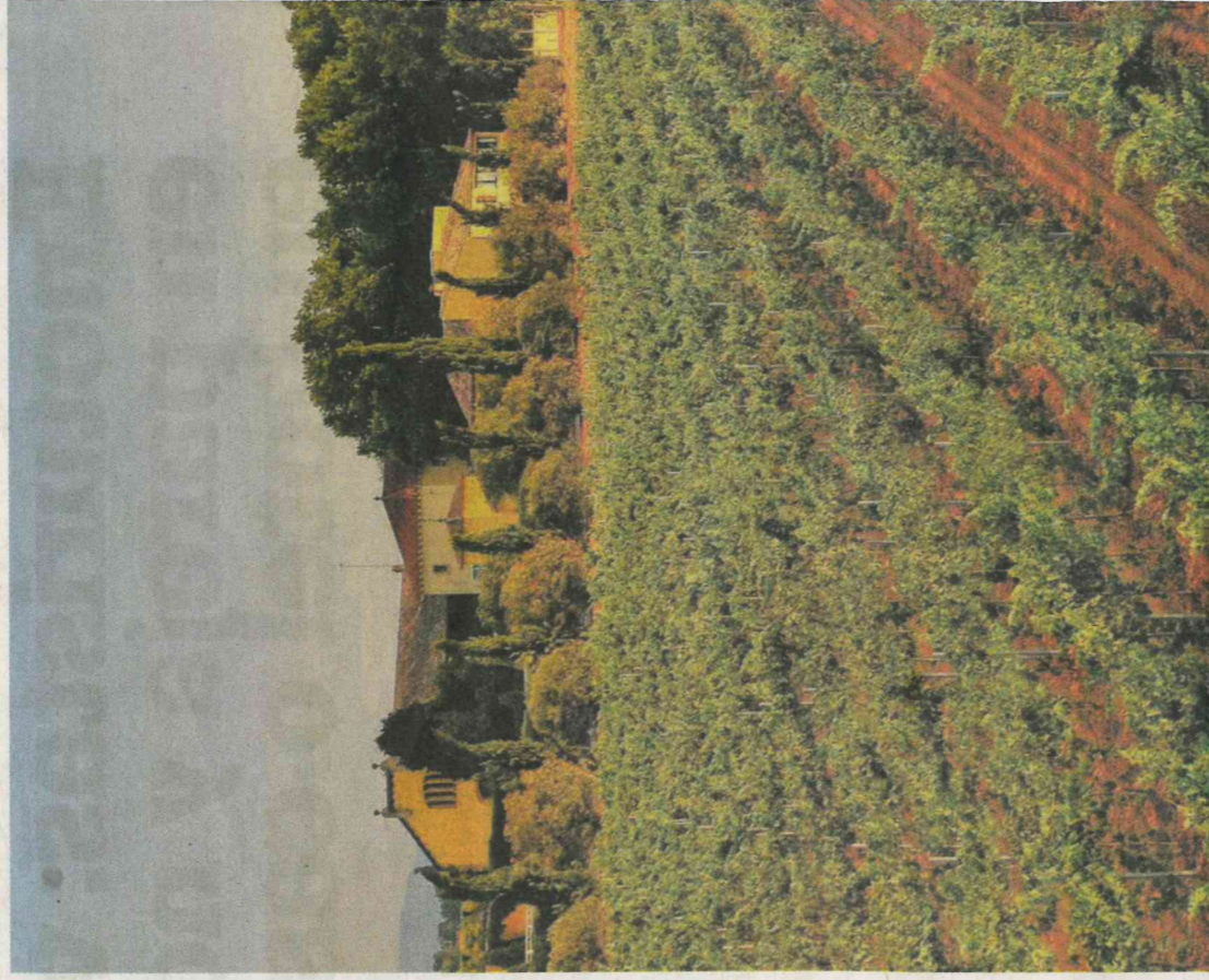
El enoturismo es algo más que visitar bodegas y beber vino, tiene muchas actividades

Cualquier época del año es buena para hacer enoturismo, las bodegas se adaptan a las distintas es-