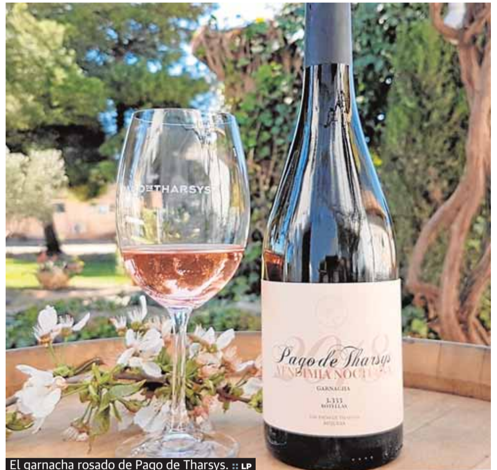
El garnacha rosado de Pago de Tharsys. :: LP

Rosé Brut Reserva. Desde la bodega nos dan una explicación breve y didáctica: el vino rosado se hace a partir de uvas tintas y el método de elaboración es el mismo que el del vino tinto, simplemente el tiempo de maceración del mosto con los hollejos o piel de la uva es mucho más corto que en el caso de los tintos. Cuanto más tiempo pasa el mosto en contacto con la piel de la uva, mayor es el color que ésta transmite al mosto y que posteriormente tendrá el vino resultante. Así, en las últimas semanas ya tenemos en el mercado el Pago de Tharsys Vendimia Nocturna Rosado 2018. Este es su primer vino rosado tranquilo, es a base de garnacha, y su vendimiado se llevó adelante la noche del 14 de Septiembre 2018 con la ayuda de la