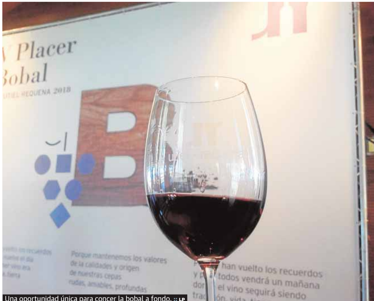
Una oportunidad única para conocer la bobal a fondo. :: LP

Las bodegas participantes de este año son: Vegalfaro, que presentara como Bobal Singular su vino Caprasia Bobal. Sierra Norte con Pasión Bobal tinto 2017 como protagonista. Jiménez-Villa Hermanos han elegido como Bobal singular de este año Nexus 2017. Hispano Suizas y