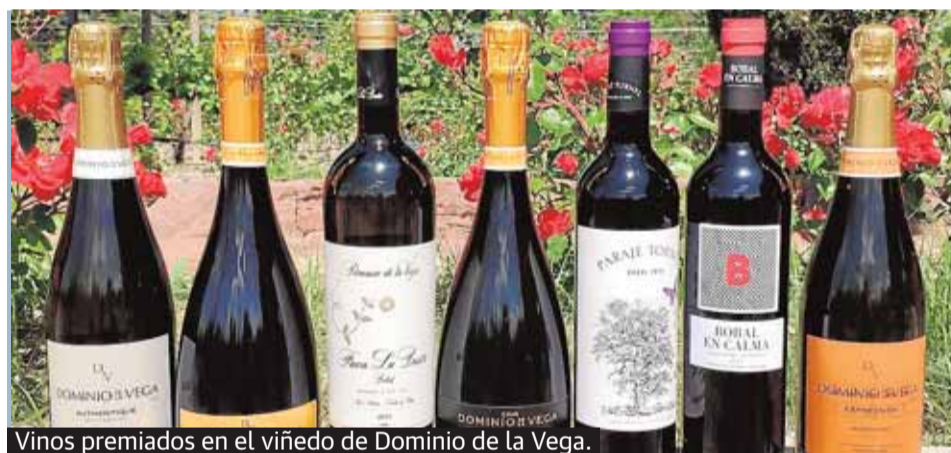
Vinos premiados en el viñedo de Dominio de la Vega.

Dominio de la Vega ha recibido siete medallas en la última edición, destacando los 94 puntos que se lleva el cava Pinarejo Cuvée Prestige, 100% chardonnay lo que lo convierte en uno de los mejores cavas del mundo. Pinarejo es un cava de finca que procede de uno de los viñedos más altos de Europa para la elabo-