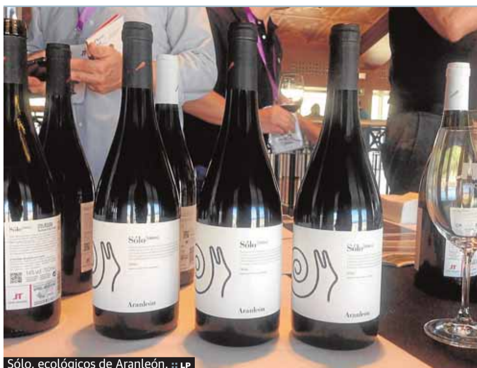
Sólo, ecológicos de Aranleón.