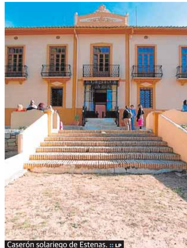
Caserón solariego de Estenas.

A nadie se le escapa que los grandes padres del refinamiento gastronómico, de la alta cocina y de la excelencia (en un tiempo) en la elaboración de los vinos la poseían los franceses. Allí existe un concepto dentro de las explotaciones vitivinícolas que hace exclusivos los que proceden de ciertas parcelas. Se conocen como Cru y Gran Cru una manera de clasificar el viñedo y sus mejo-