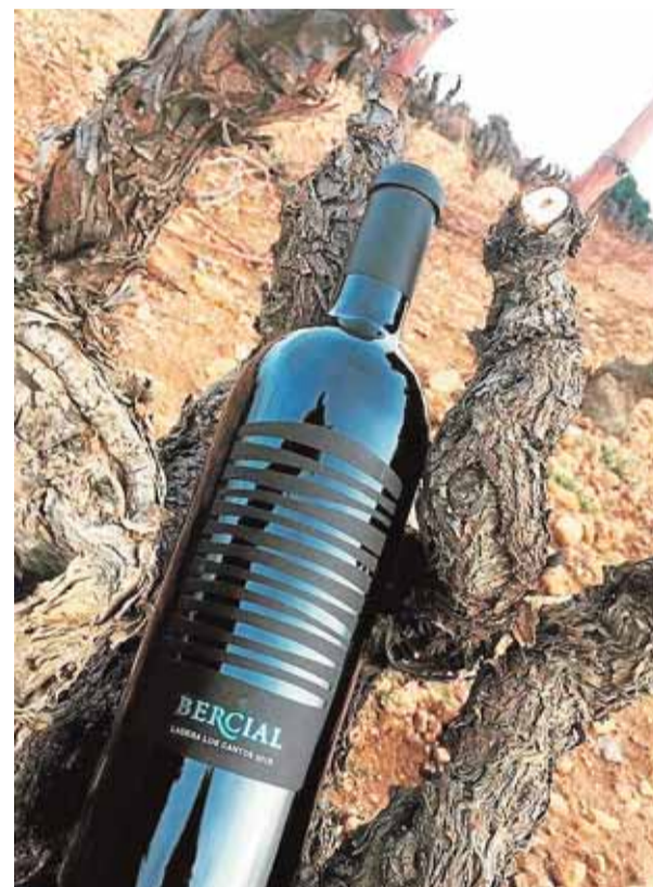
Excelente bobal ensamblado con cabernet sauvignon.

Bercial son los vinos de alta gama de Bodega Sierra Norte. Las uvas con las que se elaboran proceden de las mejores parcelas con las que cuentan en sus viñedos de Camporrobles. Y tanto por las características de sus suelos, como por su ubicación, en la zona de máxima altitud de la comarca, a 920 metros sobre el nivel del mar. Otro dato de calidad que influye en el resultado del vino es la edad del viñedo, en el caso del tinto Ladera Los Cantos, de viñas de bobal de más de 60 años y de cabernet de más de 40 años. Ambos, blanco y tinto son vinos de alta expresión con paso por madera, integrada a la perfección respetando la identidad de la fruta, que se deja sentir en la cata gracias a un cuidado proceso de elaboración. Estos vinos fueron diseñados en su día por la actual mejor enóloga de la Comunitat Valenciana, la requenense Mapi Domingo. Esta enóloga forma parte del equipo técnico de la bodega valenciana Sierra Norte, a la que se incorporó en 2005. Además de los Bercial, participó en el alumbramiento de otras referencias de calado en la bodega, como son los Pasión de Bobal y Mariluna. En su diseño primigenio se quiso colocar a la bobal como piedra angular del tinto, completándolo con la cabernet sauvignon. Este vino pasa por barrica de primer uso de roble francés durante 18 meses, para después permane-