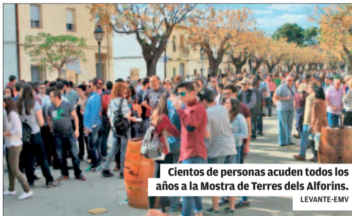
Cientos de personas acuden todos los años a la Mostra de Terres dels Alforins.

Pero el evento de Terres dels Alforins cuenta con más ingredientes al margen de éste principal que