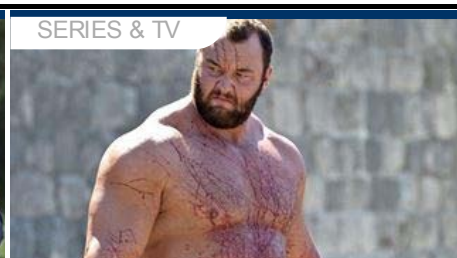
Juego de tronos: La Montaña se transforma en el increíble Hulk