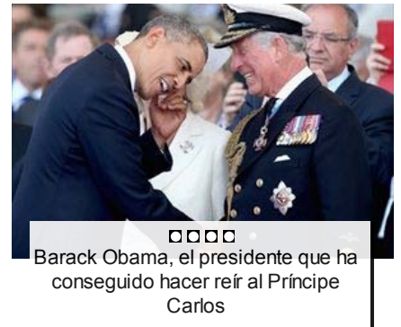
Barack Obama, el presidente que ha conseguido hacer reír al Príncipe Carlos