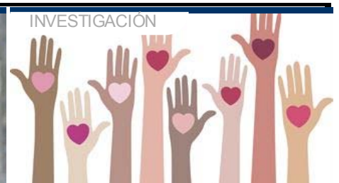
Los beneficios del altruismo

Portal de actualidad y noticias de la Agencia Europa Press. Publicación digital auditada por OJD.