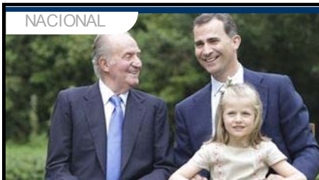
La Infanta Leonor recibirá formación militar para ser la futura jefa suprema de las Fuerzas Armadas