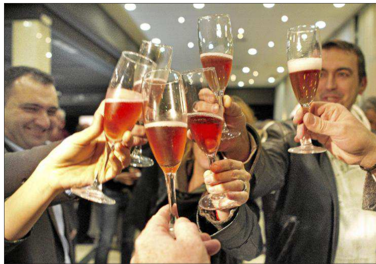
Un momento de la degustación celebrada ayer.

Los vinos de Utiel-Requena están presentes en 64 países que absorben en total unos 40.420.598 millones de euros de inversión anual. Concretamente, los caldos de esta comarca tienen una mayor presencia en Francia, seguido de