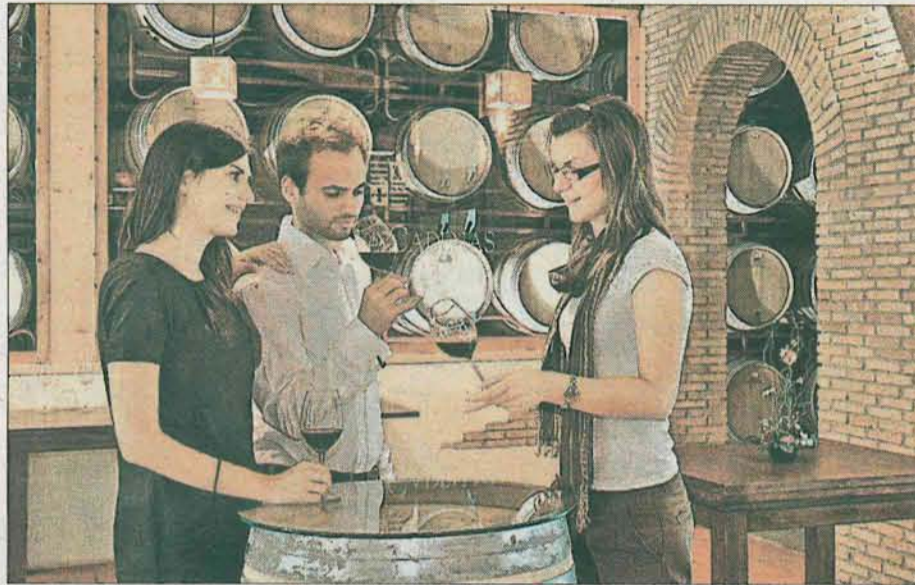
El interés por la cultura del vino ha impulsado el enoturismo. CUESTIÓN DE GUSTO

En la región vitivinícola de Utiel-Requena sucede algo parecido durante estos días festivos, y bodegas como Hoya de Cadenas, Pago de Tharsys, Hispano+Suizas, Chozas Carrascal, Vera de Estenas o Dominio de la Vega reciben a diario a decenas de personas que buscan conocer en primera persona qué hay detrás de la elaboración de los vinos y cavas de esta comarca. Este auge del enoturismo se extiende también a otros