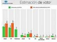
Estimación de voto del ObSERvatorio