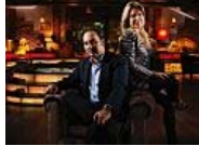
El programa más importante de 'Cuarto Milenio'