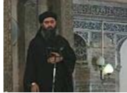
Abu Bakr, líder supremo del Estado Islámico por el que se ofrecen 10 millones...