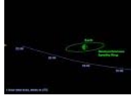
Un asteroide 'roza' otra vez la Tierra