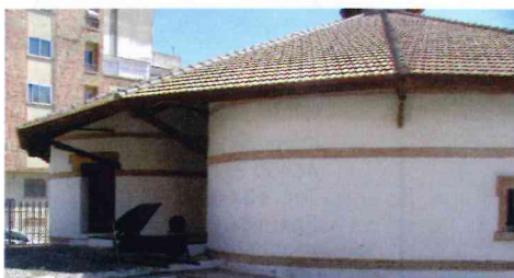
Bodega Redonda, sede del C.R.D.O. Utiel-Requena.