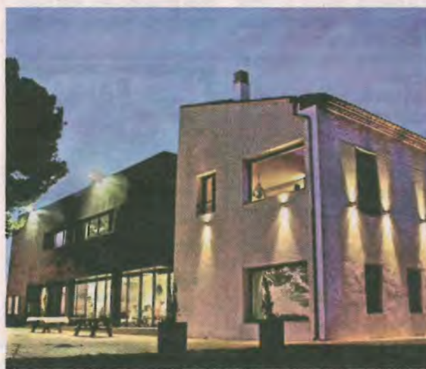
Hispano+Suizas se encuentran en El Pontón.

dot, syrah (esta la implantaron los cruzados en la Galia a la vuelta de Tierra Santa), merlot y cabernet franc, aunque su cuerpo principal lo compone la autóctona bobal. Todas ellas proceden de ese mismo pago para más inri, un auténtico mestizaje vinico que tras una cuidada elaboración y veinte meses de barrica se