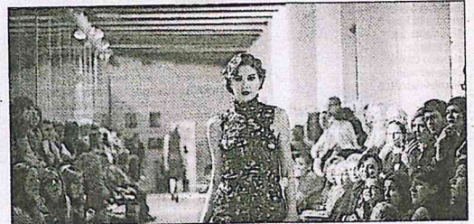
Desfile del Circuito de la Moda en una edición pasada.